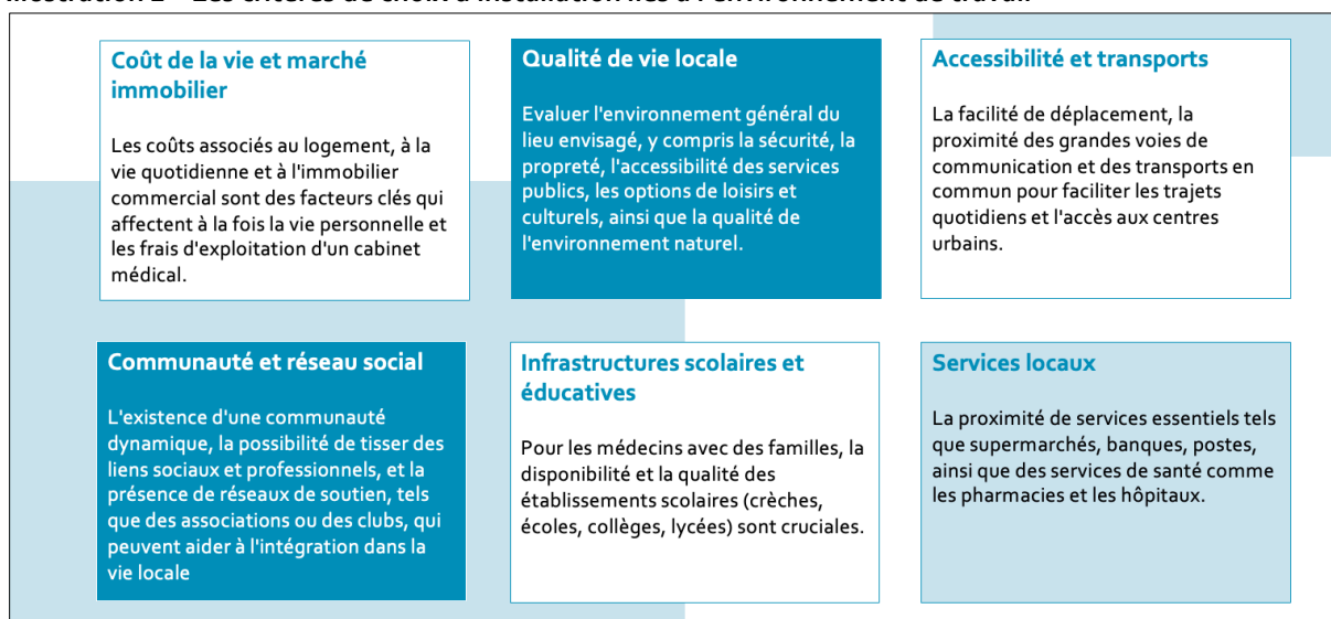
Illustration 2 – Les critères de choix d'installation liés à l'environnement de travail

La qualité de l'environnement de travail est déterminante pour les patients mais aussi pour le bien-être personnel et familial du médecin.