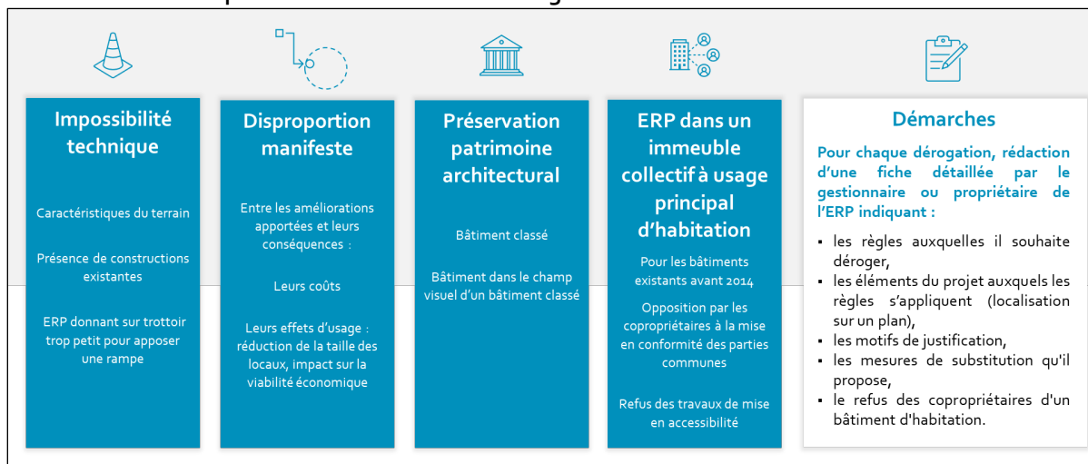
Illustration 2 : Motifs possibles de demandes de dérogations

Les dérogations aux règles d'accessibilité aux personnes en situation de handicap et à mobilité réduite ne sont possibles que pour les ERP existants . Aucune demande n'est possible pour un bâtiment neuf ou récent qui doit par définition être conforme aux normes actuelles.