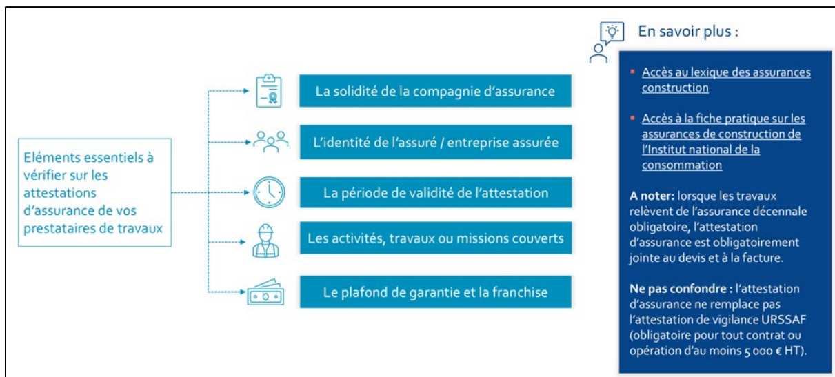
Illustration 3 : Les éléments essentiels à vérifier concernant les assurances d'une société

De la même façon que vous aurez pris le temps de vérifier l'existence de leur société, vous pouvez vérifier la solidité de leur compagnie d'assurance en recherchant des éléments grâce aux sites mentionnés ci-dessus.