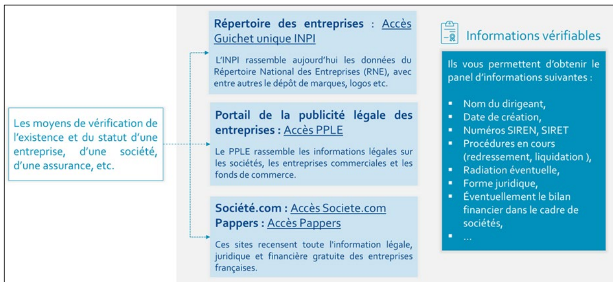
Illustration 2 : Moyens de vérification de l'existence d'une société

L'ancienneté de l'entreprise peut être un gage de sérieux et montrer un certain professionnalisme. En revanche, il ne faut pas se fier uniquement à ce critère